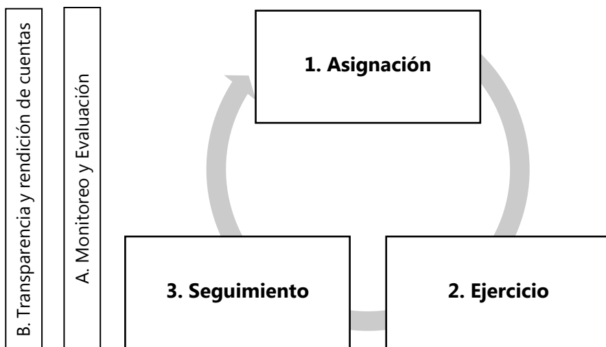
Tabla 1. Principales procesos del fondo