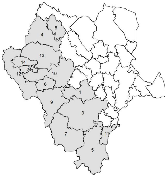
Figura 1. Municipios cobertura del PTL